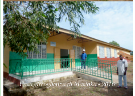
Casa Accoglienza di Masiaka - 2016

Grazie anche dagli Amici della Sierra Leone