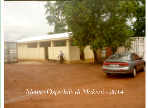
Mensa Ospedale di Makeni - 2014