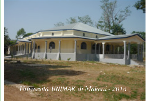
Università UNIMAK di Makeni - 2015