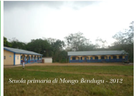
Scuola primaria di Mongo Bendugu - 2012