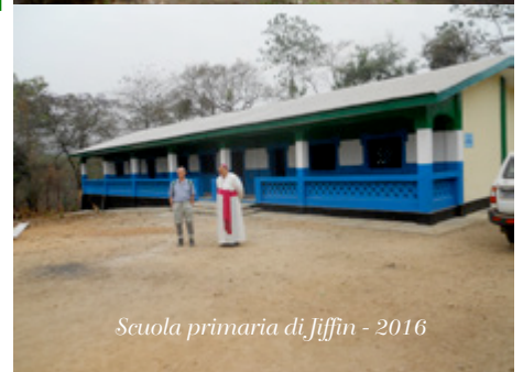
Scuola primaria di Jiffin - 2016